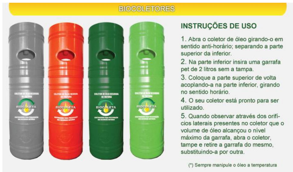
Figura 2 – Apresentação dos biocoletores